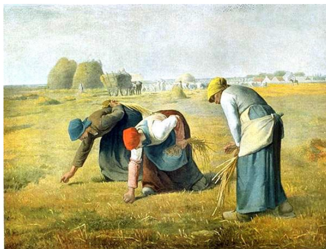
Tableau : "Des glaneuses", Jean-François Millet, 1857

Une coutume historique qui consiste à ramasser des fruits, des légumes et des céréales restés ou tombés au sol dans un champ ou un verger après la récolte. Au fil du temps, les pratiques de glanage alimentaire se sont diversifiées, faisant émerger des formes variées, à la fois rurales ou plus urbaines, individuelles ou collectives.